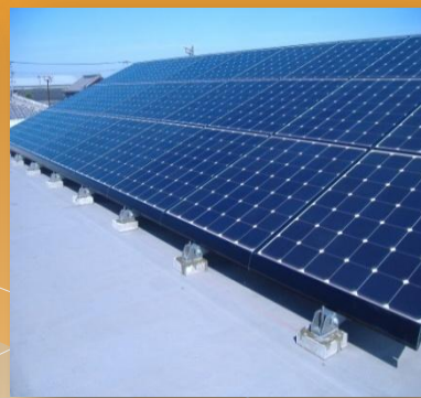
(いろいろな屋根に)