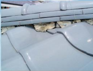
シッキイのはがれ